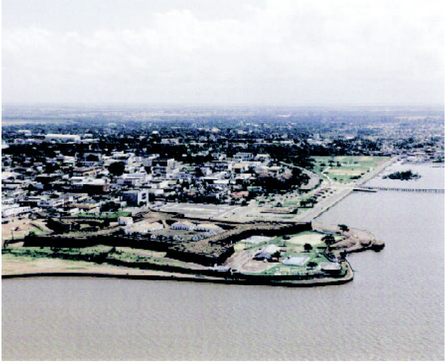
Macapá; em primeiro plano, o forte de São José de Macapá, uma das mais belas e maiores fortificações do Brasil, vigiando a margem esquerda do Amazonas

trágica cultura burocrática responsável pela expulsão de sua gente, para uma nova situação trazida pelo intercâmbio intenso com o resto de mundo, onde os amapaenses passarão a ser identificados e considerados perante a Nação, numa redefinição dinâmica.