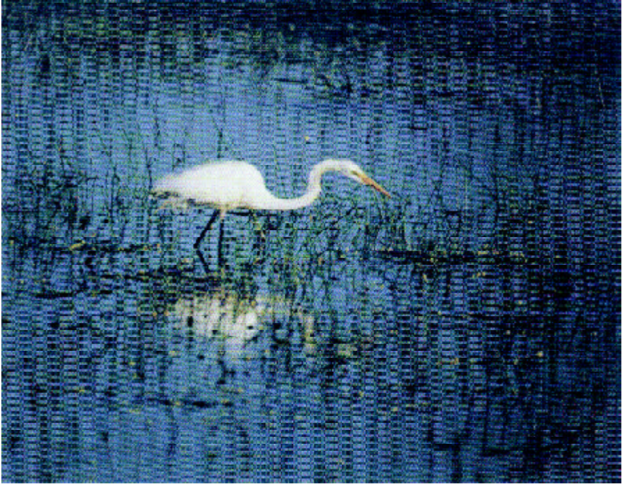
Garça real nos alagados do Pracuúba

do outro lado do rio Amazonas, nos grandes projetos do Jari: vão sempre em busca de um vir-a-ser impossível de se realizar dentro de casa e deixam, no rastro, a ferida da perda que se desmancha sonoramente no mar-abaixo.