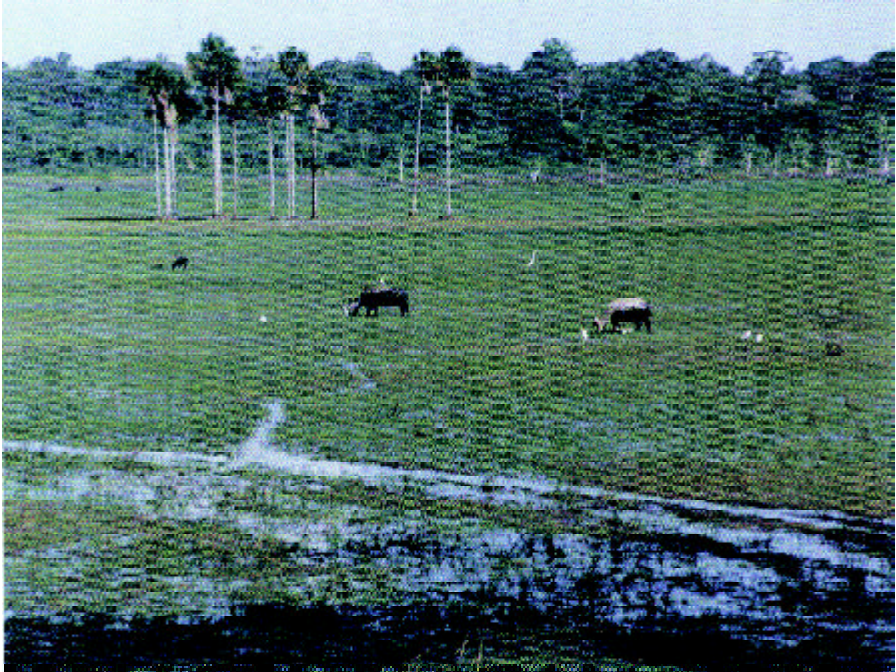
Campos do Araguari com búfalos e garças

Tem, pois, o Amapá uma vocação natural para a produção de proteína muito superior à capacidade interna de consumo, o que faz deste cenário norte-hemisférico um caso excepcional no contexto brasileiro.