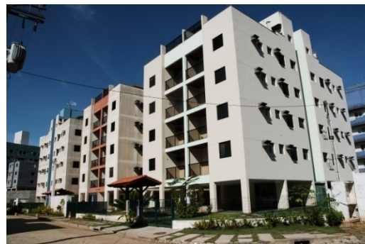
Praias de Ubatuba