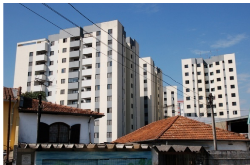
Portal do Jabaquara