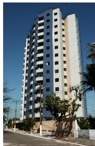
Pq. das Flores