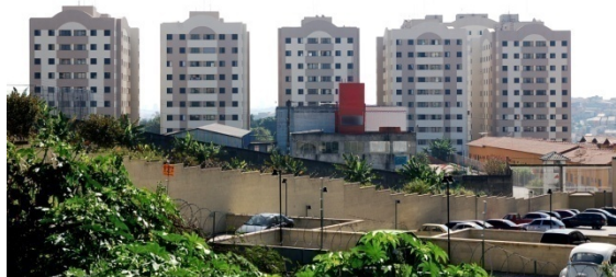
Veredas do Carmo