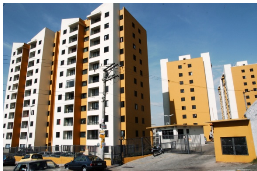
Moradas da Flora