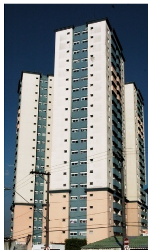
Recanto das Orquídeas