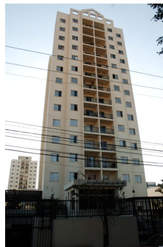
Jd. da Saúde