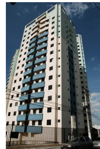
Solar de Santana