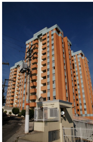
Torres de Pirituba