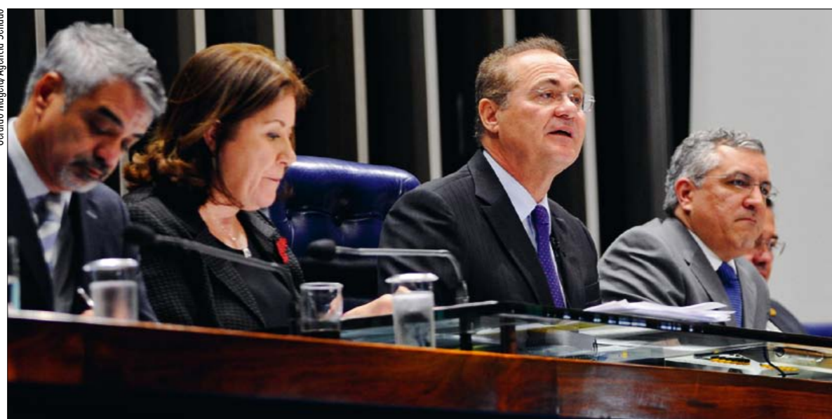
Entre a ministra Miriam Belchior e o então ministro Alexandre Padilha, o presidente do Senado, Renan Calheiros, fala sobre o SUS

— Em todo o Brasil, o cidadão que procura tratamento frequentemente depara com toda sorte de desrespeito, como longas filas e descaso. Isso é inaceitável, porque a manutenção da saúde está ligada ao direito à própria