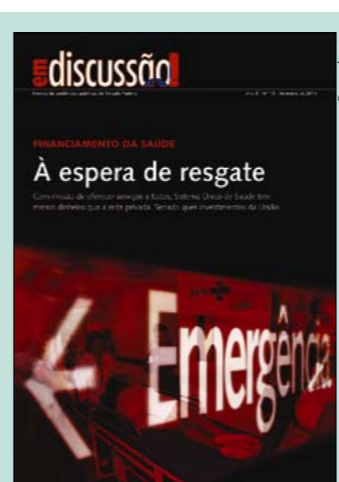
A capa da 19ª edição da revista Em Discussão! , sobre saúde pública

Para Mário Scheffer, professor de Medicina Preventiva da Universidade de São Paulo (USP), a má qualidade do SUS tem empurrado os brasileiros para a saúde privada. Em 2000, 31 milhões de pessoas tinham plano de saúde. Hoje, 48 milhões. Afirma ele à revista Em Discussão! : — Nem mesmo os clientes dos planos estão satisfeitos. Os convênios já mostraram que não