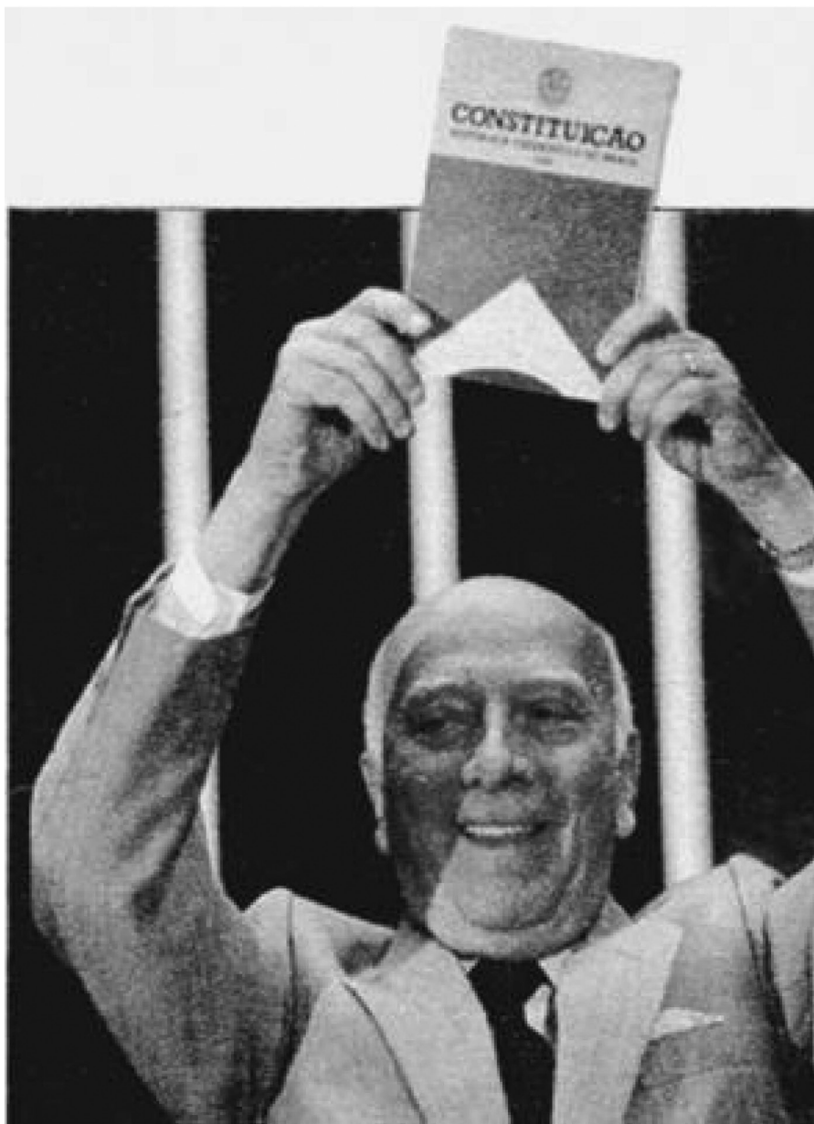
Ulysses Guimarães e a Constituição de 1988