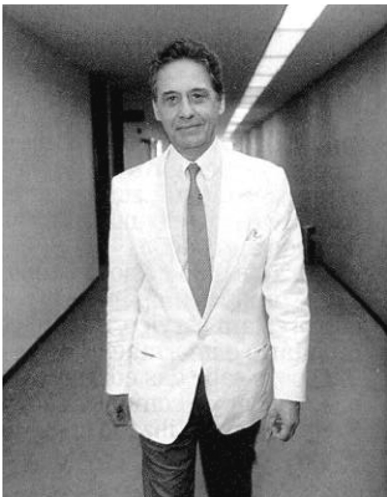
Fernando Henrique Cardoso, Senador