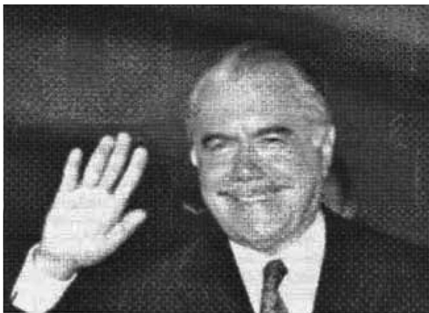
José Sarney, Presidente da República