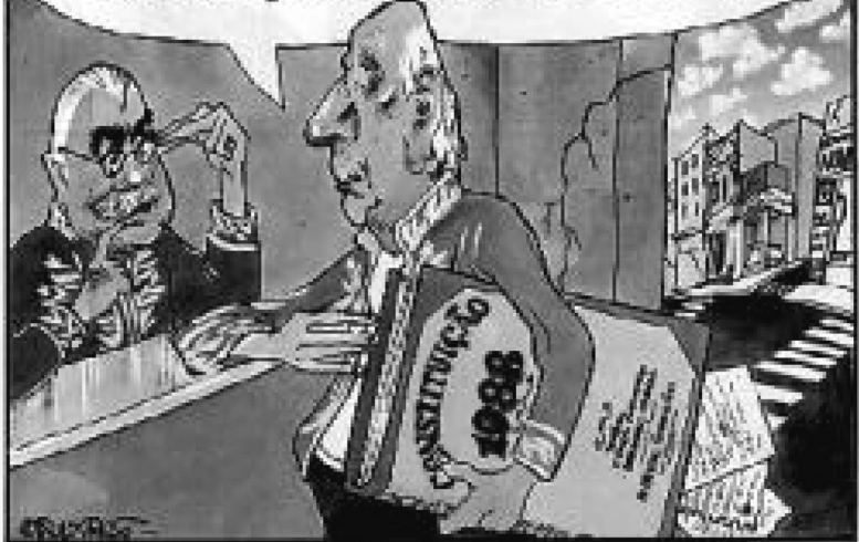
Charge por Paulo Caruso

...TÔ ACABANDO UM ROMANCE QUE VAI ABALAR AS ESTRUTURAS!!